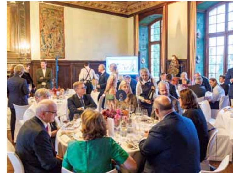
Mit einem professionellen Catering und zufriedenen Gästen wird jeder Anlass zum Erfolg