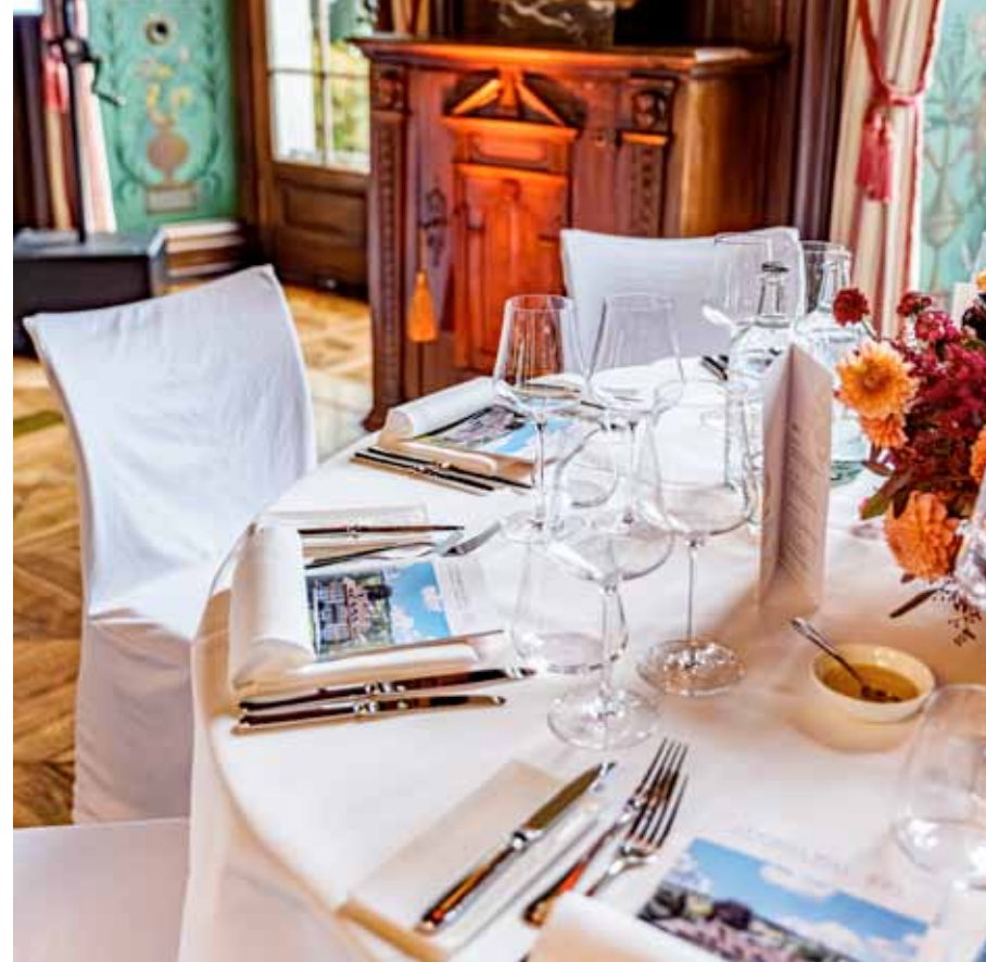
Stimmungsvolle Akzente unterstreichen jeden Anlass

Insgesamt durften wir im Jubiläumsjahr 114 Veranstaltungen durchführen – 20 Anlässe mehr als im Vorjahr. Da insbesondere der Anteil an Kulturveranstaltungen zugenommen hat und weil dafür aufgrund des Öffentlichkeitscharakters Spezialkonditionen gelten, entwickelte sich der Umsatz jedoch nicht proportional zur Anzahl der Anlässe.