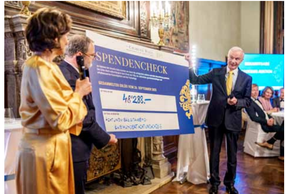
Der Auktionserlös wird vollumfänglich für Erhaltungsmaßnahmen der Villa eingesetzt