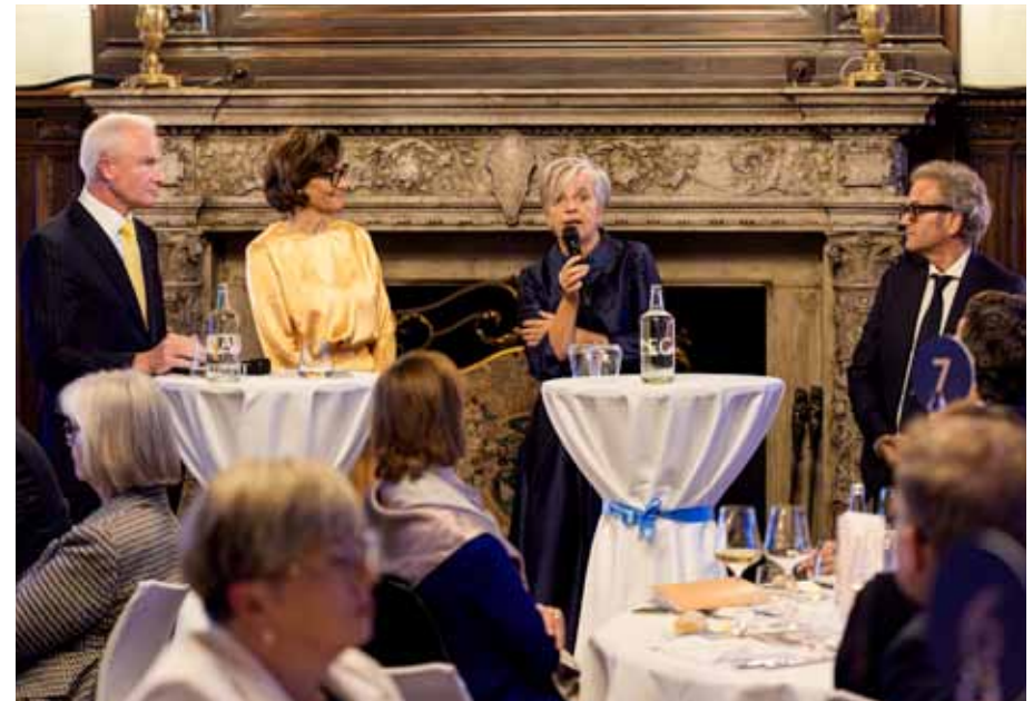
Podiumsgespräch zu Geschichte und Denkmalschutz